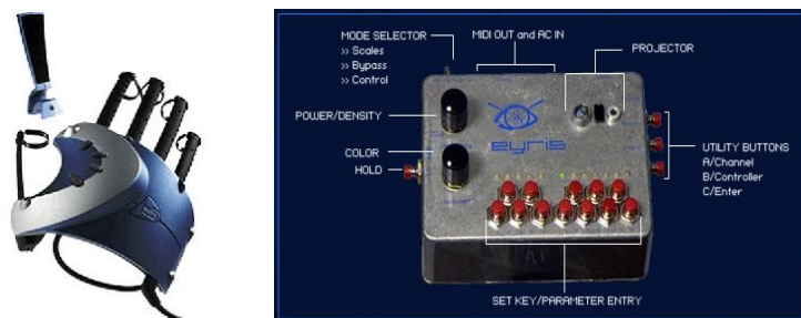
Figura 1. Guante P5 y controlador Eyriss

El sonido de toda la obra es cuadrafónico, tanto en los procesos en tiempo real como en las secciones que tienen elementos pre-grabados. Los cuatro canales que salen del computador y los sonidos provenientes de los instrumentos entran a un mezclador principal donde son espacializados adecuadamente. En algunas secciones las voces entran directo a la consola y son amplificadas (con algo de reverberación de un procesador externo), mientras que en otras, las voces pasan por procesos electrónicos en el computador.